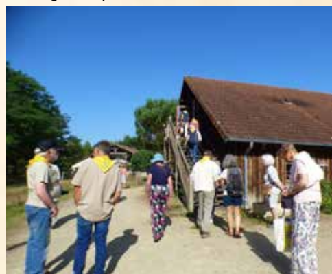
Le refuge jacquaire des Neuf Fontaines