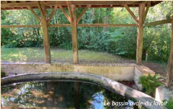
Le bassin ovale du lavoir