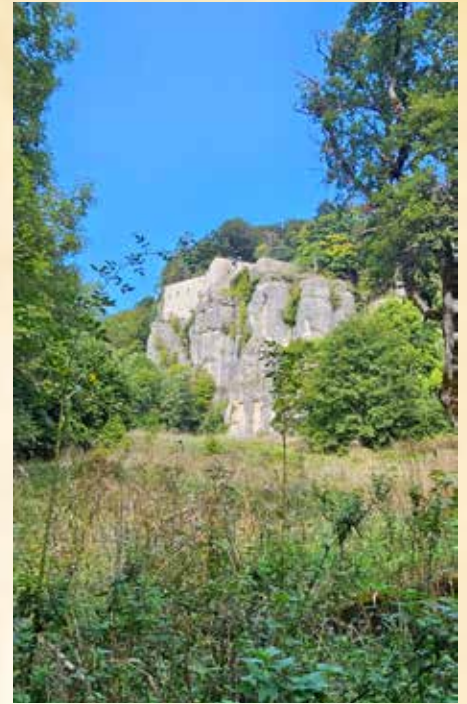
La colline de La Verna