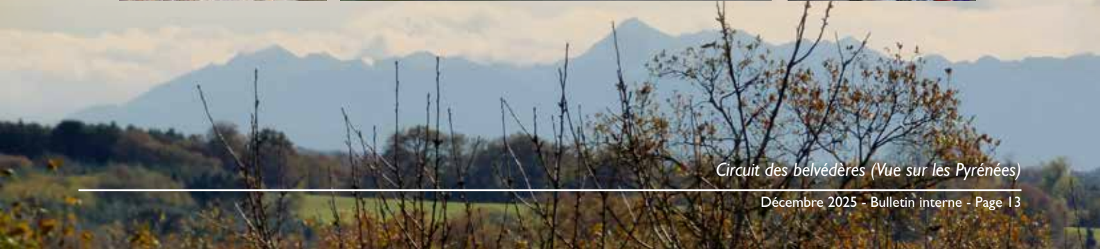
Circuit des belvédères (Vue sur les Pyrénées)