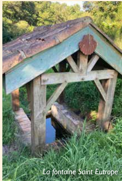
La fontaine Saint Eutrope