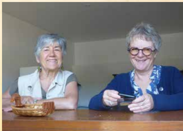
Nos hôtesse de l'APE des Neuf Fontaines