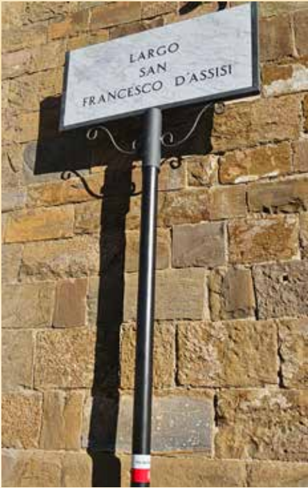
La Via Ghibellina