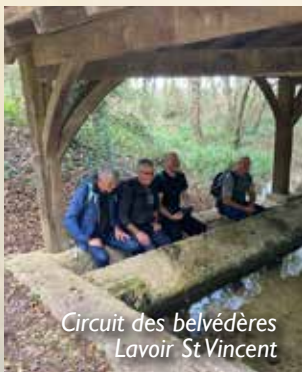
Circuit des belvédères Lavoir St Vincent