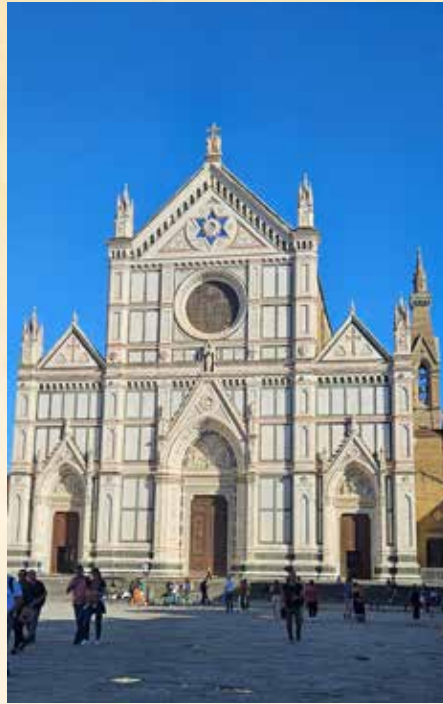
Cathédrale Santa Croce début du chemin