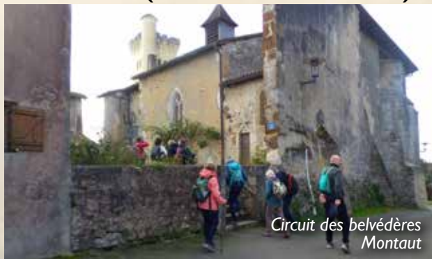
Circuit des belvédères Montaut