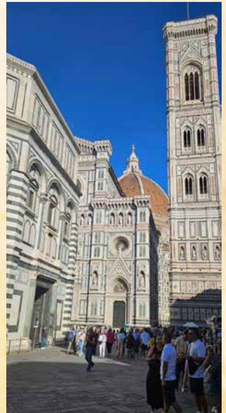
Florence Piazza del Duomo