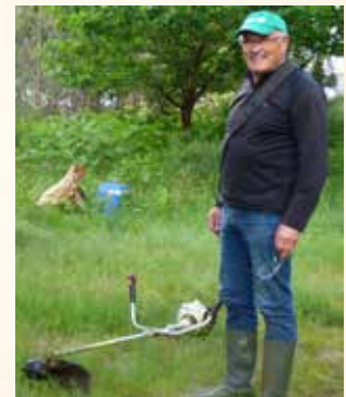
Nettoyer les ruines de la commanderie de Bessau