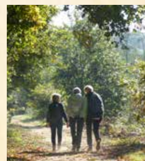
Organiser des circuits de promenades (Orx)

Vous l'avez compris, nous avons aussi un grand besoin de bénévoles dans notre équipe d'hospitaliers qui s'activent dans nos 6 refuges où, bon an mal an, nous comptons plus de 4000 nuitées (4300 cette année 2025). L'hospitalité incarne l'esprit du Chemin, fait de partage, de bienveillance et de fraternité. L'accueil ne se limite pas à un lit et un repas, c'est aussi des moments merveilleux d'échanges, d'écoute et de réconfort où le pèlerin donne souvent autant qu'il reçoit. Tous les hospitaliers vous le diront, c'est une expérience inoubliable, enrichissante, profonde.