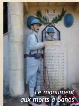
Le monument aux morts à Banos