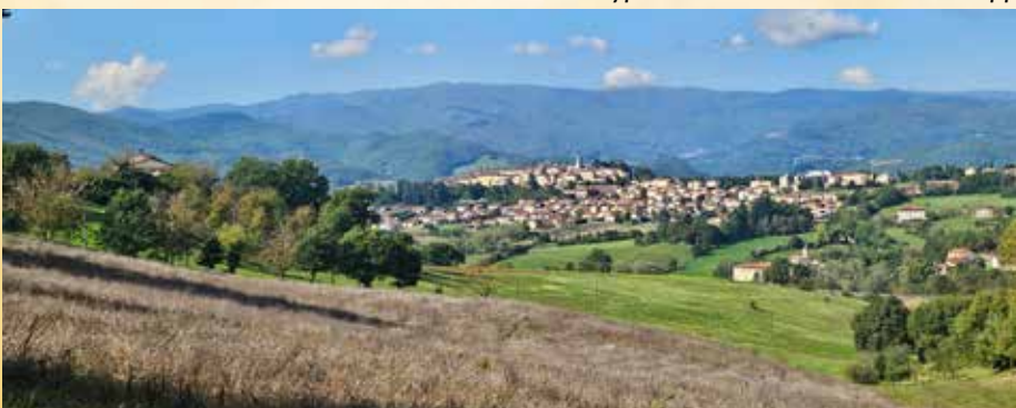
La ville de Poppi