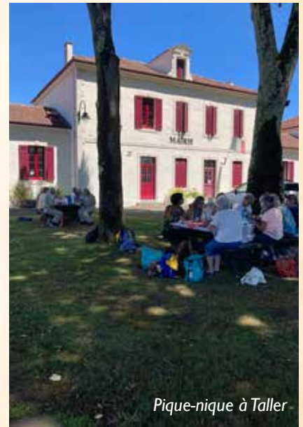
Pique-nique à Taller