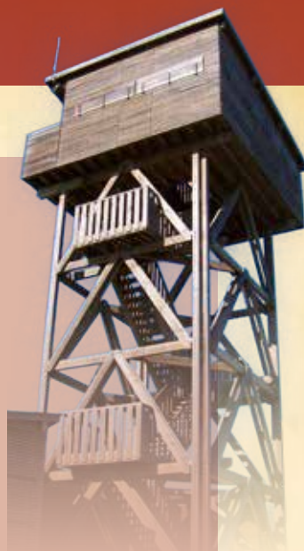
L'observatoire à Arjuzanx