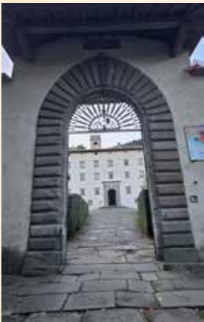
L'Abbatiale de Vallombrosa