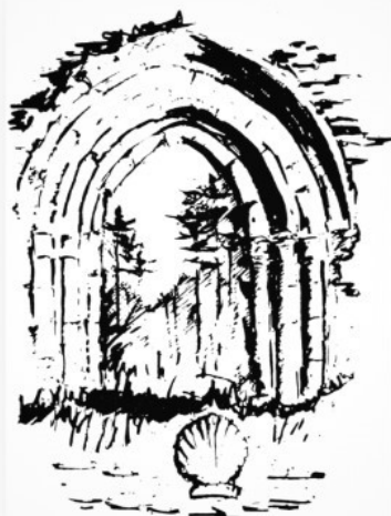
Portail de Bessaou