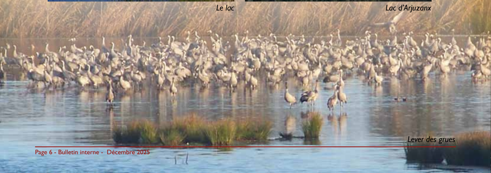
Lever des grues