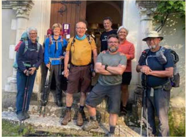
Accueillir (refuge de Vialotte)