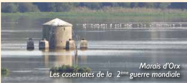
Marais d'Orx Les casemates de la 2 ème guerre mondiale