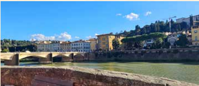
L'Arno à Florence